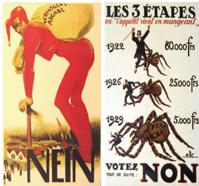
Abbildung 2: Beispiele für Plakate der Abstimmungsgegner

Die Gegner der Vermögensabgabe hatten Argumente von denen sie weite Teile der Bevölkerung überzeugen konnten. Die Überzeugungsarbeit wurde einerseits, ähnlich wie heute, über emotionale Plakat-Kampagnen geführt. Sie stellten die theoretisch wesentlichen Nachteile einer einmaligen Vermögensabgabe visuell dar. Abbildung 2 zeigt als Themen die Last, die eine Vermögensabgabe für die Industriellen darstellt, den Enteignungscharakter solcher Abgaben und weist auf die Unglaubwürdigkeit des Einmal-Charakters hin.