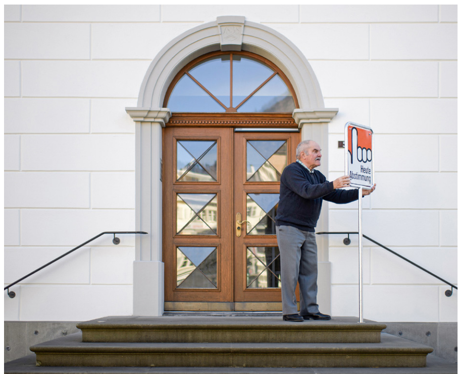
Abstimmungstafel vor dem Gemeindehaus in Glarus – einem der drei verbliebenen im Kanton.