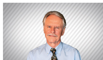
Bruno S. Frey

tet auf einen geringeren Bezug des Stimmbürgers zur demokratischen Politik hin, was sich sogar im Ausmass der Stimmbeteiligung auf Ebene der eidgenössischen Abstimmungen auswirkt. Die emotionale Verbindung zum Wohnort hat sich vermindert. Diese bedauerliche Entwicklung kann sich durchaus in den nächsten Jahren wieder umkehren, wenn die Bevölkerung sich an die drei neuen Gemeinden gewöhnt hat. Klar ist jedoch: Die weitere Entwicklung des Bezugs der Bürgerinnen und Bürger zu deren politischer Einheit sollte unbedingt im Auge behalten werden.